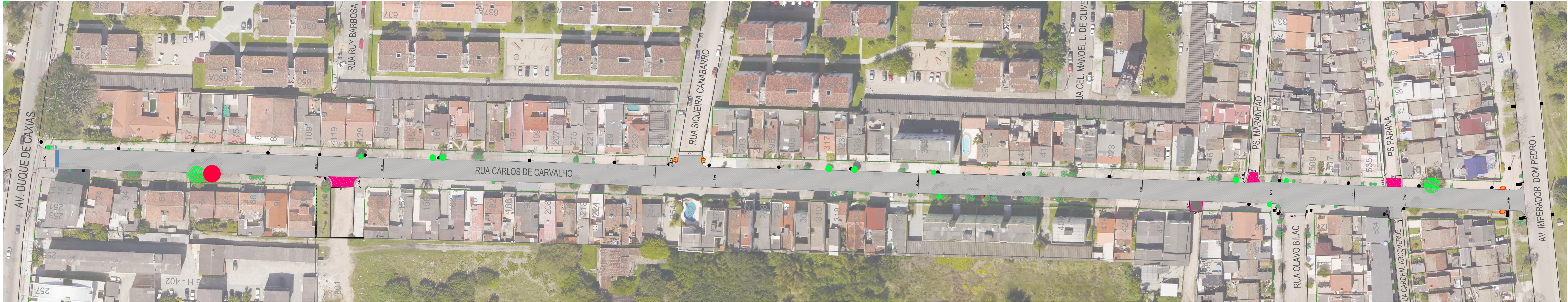
PLANTA BAIXA ESC. 1:750