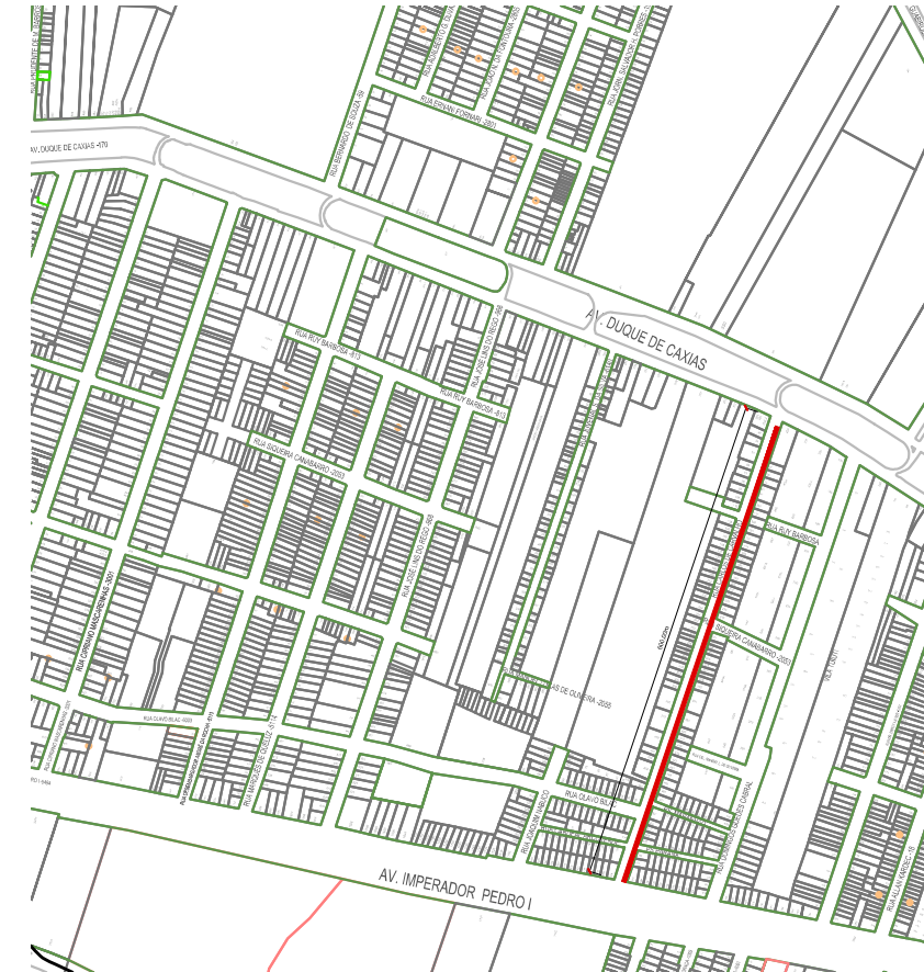
PLANTA DE SITUAÇÃO ESC. 1:10000